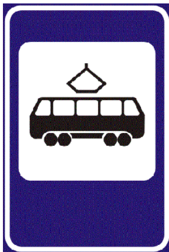
Место остановки трамвая

Если у вас по дороге в садик или в школу есть подземный переход, то обязательно покажите его ребенку.