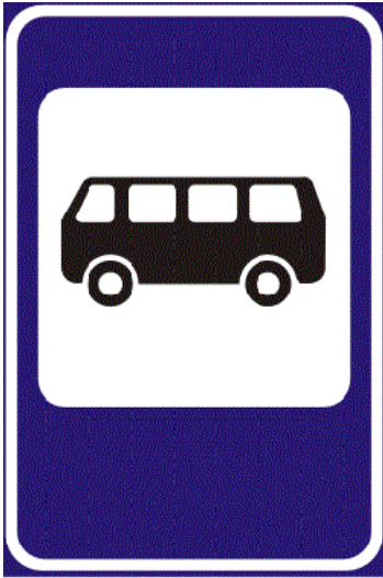
Место остановки автобуса

« Место остановки автобуса » - это также информационно-указательный знак. Он информирует и указывает нам на то, что в этом месте останавливается автобус. Устанавливается этот знак вплотную к посадочной площадке - месту ожидания транспорта для пассажиров.